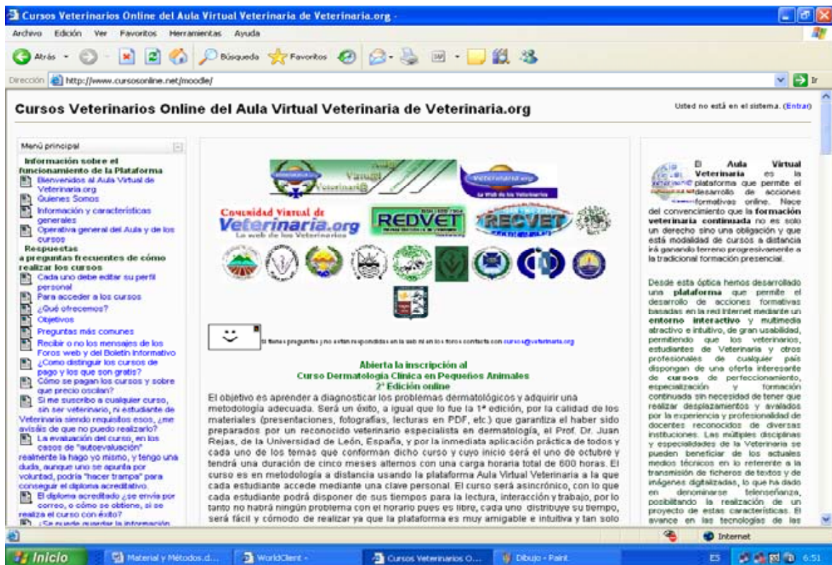
Figura 1. Aula Virtual Veterinaria.